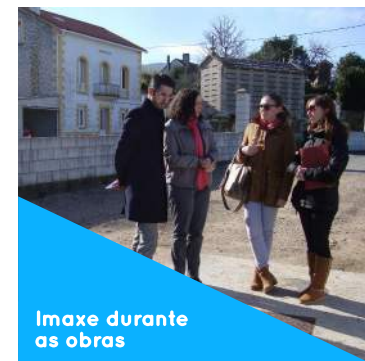
Imaxe durante as obras