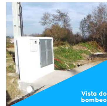
Vista do bombeo

Trátase dunha actuación complexa que ten como obxectivo conectar e completar a rede de saneamento existente co bombeo situado preto da Aguieira. Para elo é preciso definir outro bombeo no lugar de Orseño, así como un cruce co río Quintáns.