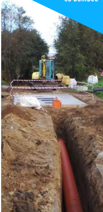
Vista da conexión co bombeo