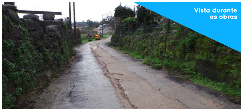
Vista durante as obras

Orzamento 44.969,77€ Data de finalización Febreiro 2014 Financiamento Concello de Porto do Son