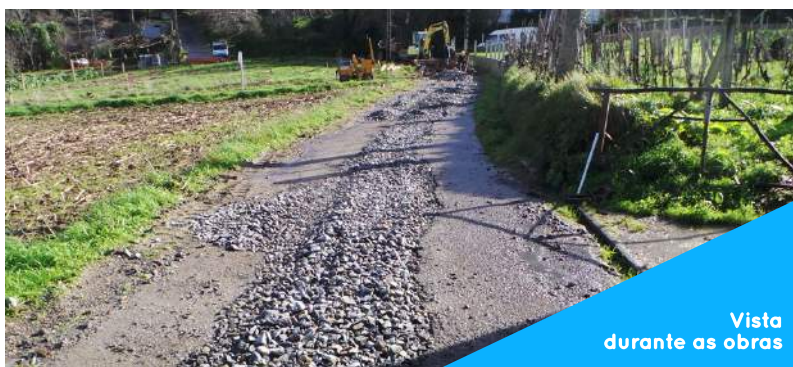
Vista durante as obras